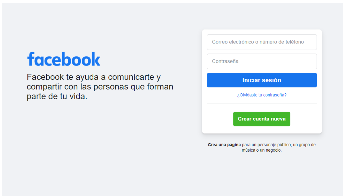
Figura 3. Facebook. Crea una página HTML que emule el Login de Facebook. Pon atención a las sombras, colores y fuentes.